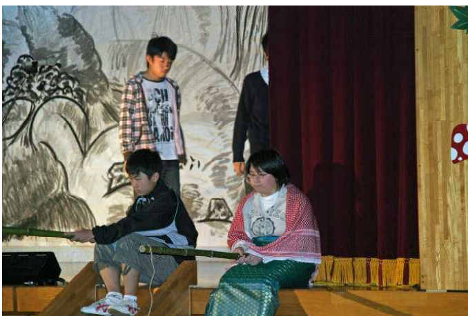
名演技で観客を魅了！