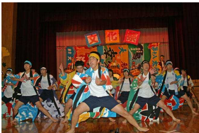
迫力ある演技で圧倒！！

なお、当日の食品販売、ママさん喫茶の収益金は以下のとおりです。収益金は生徒の活動補助費に活用させていただきます。