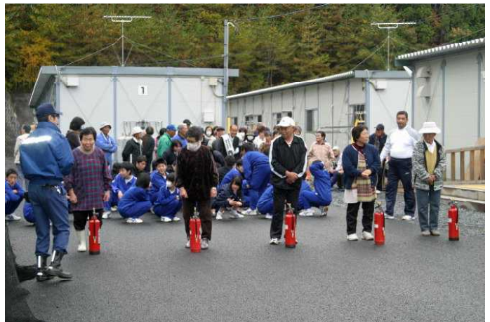
消火器で消火訓練