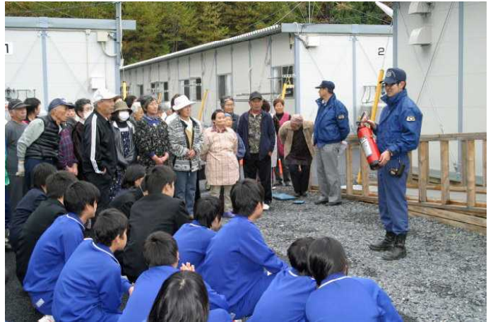
仮設の方も一緒に消火器の使い方を

なお、訓練に対する生徒の自己評価は以下のとおりでした。いつでも真剣に取り組めるよう指導を続けたいと思います。